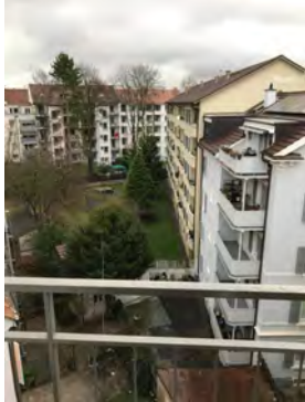
Aussicht Treppenhaus Innenhof