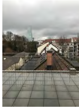
Aussicht Dach zur Stadt