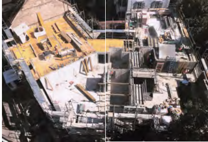
Baustelle Lehenmattstrasse / Baldeggerstrasse