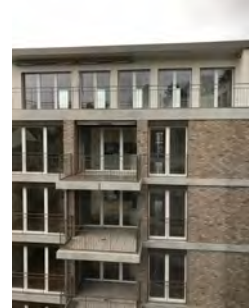
Hofansicht Fassade NB