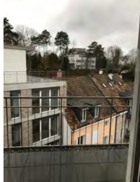
Aussicht Dach zum Innenhof