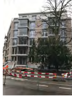
Eckansicht Fassade NB