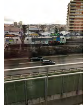
Aussicht Dach zur Autobahn